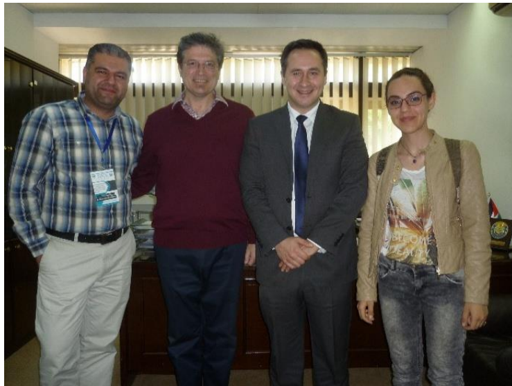
AT THE INTERNATIONAL OFFICE OF JUST, IRBID.