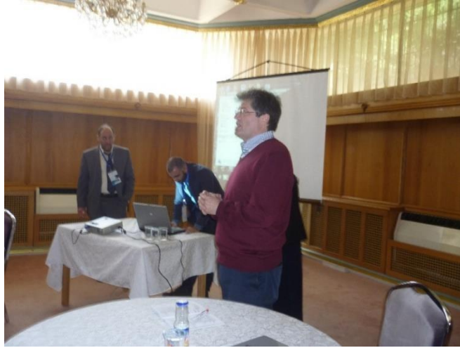
LECTURING AT JUST, IRBID, JORDAN